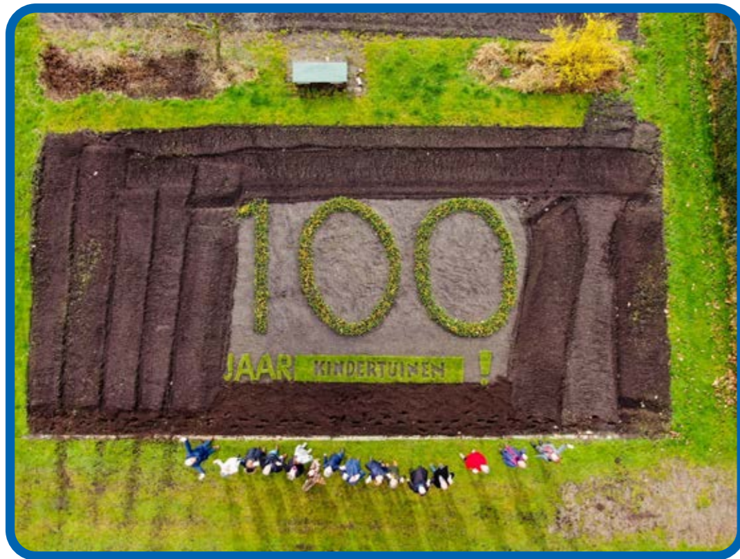
Jawel, een foto genomen met drone!