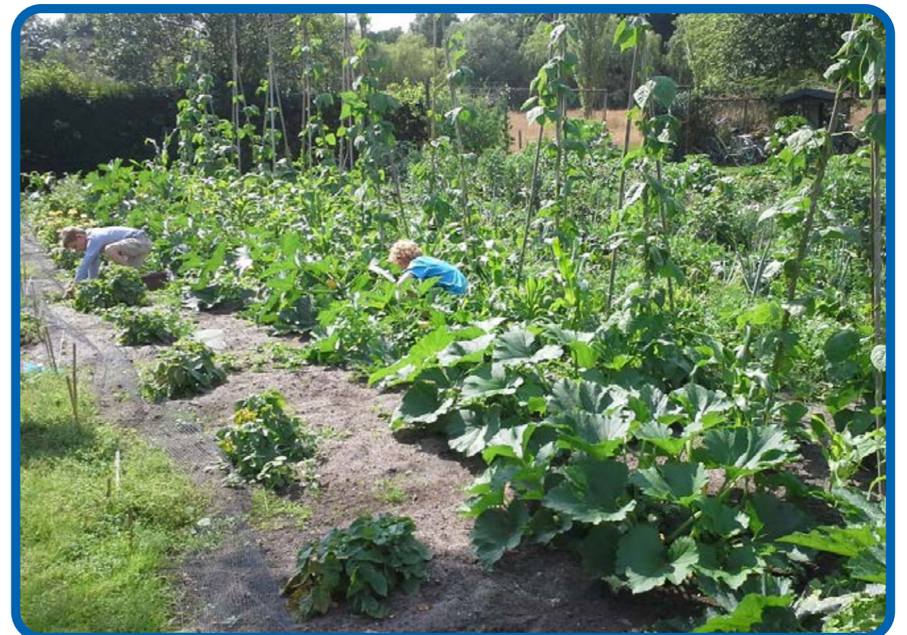
en daarna gaat t hard