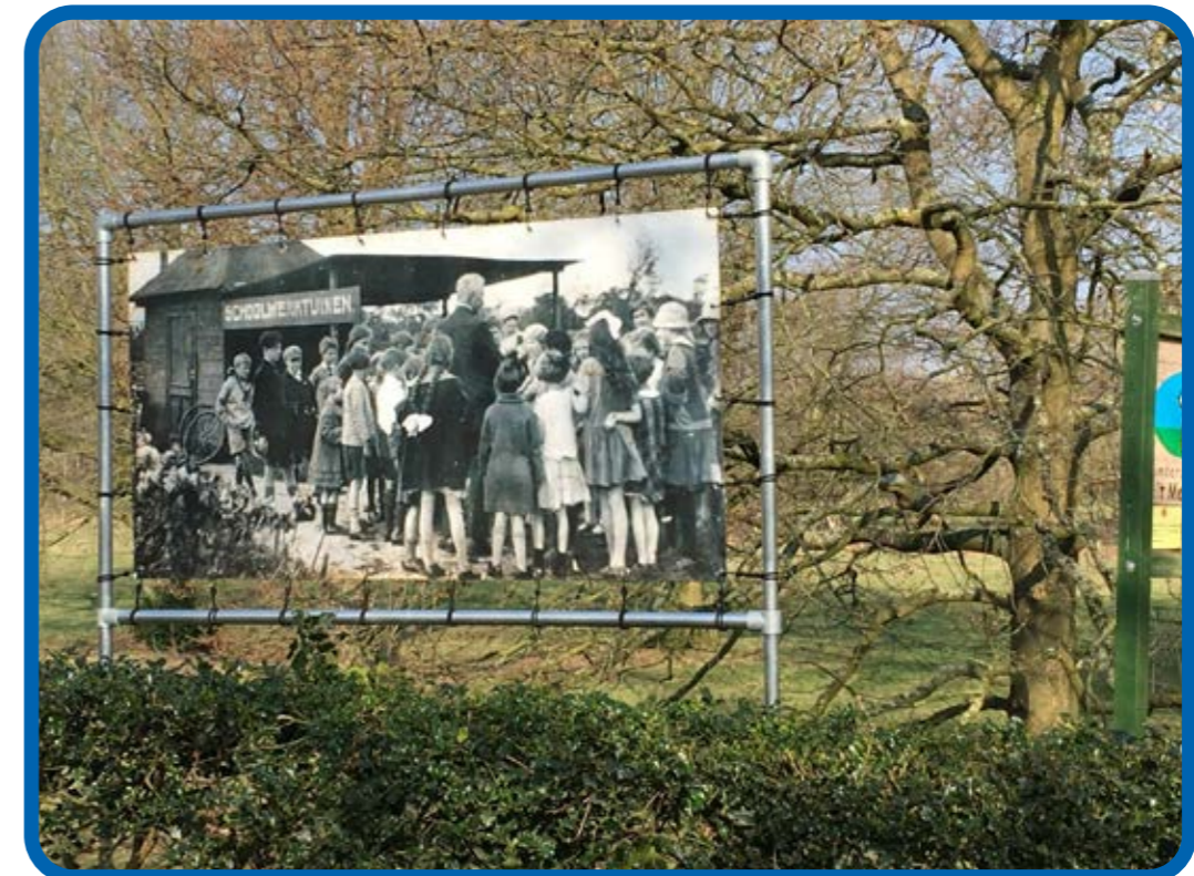
De foto van ongeveer honderd jaar geleden aan de Huizerweg trok veel bekijks

verschillend gezien: van verheffing van het volk en voedselvoorziening via vrijetijdsbesteding naar educatie en natuurbeleving. De verdienste die wij nu brengen is dat we de kinderen in de "supermarkttijd" bekend maken met waar hun voedsel vandaan komt en dat we de gelegenheid bieden om buiten in de natuur te zijn en te bewegen. Dat we door hen zelf voedsel te laten verbouwen hen respect bijbrengen voor wat ze eten. En uiteindelijk dat we hen bewust maken van het gegeven dat we zorgvuldig moeten omgaan met wat de aarde ons biedt. We streven er daarom ook steeds meer naar om op de tuintjes op een duurzame manier te produceren. We prijzen ons gelukkig met een aantal jonge nieuwe medewerkers die ons niet alleen wat betreft duurzaamheid, maar ook wat betreft communicatie bij de tijd houden: er werden appgroepen aangemaakt, we gingen op facebook en op instagram en we kregen voor onze foto's een dropboxbestand. Voor het eerst zullen de ouders bij ons ook digitaal via mobiel pinapparaat hun lesgeld kunnen betalen. We zijn klaar om de komende honderd jaar in te stappen en om onze handen en die van de kinderen weer als vanouds flink te laten wapperen!