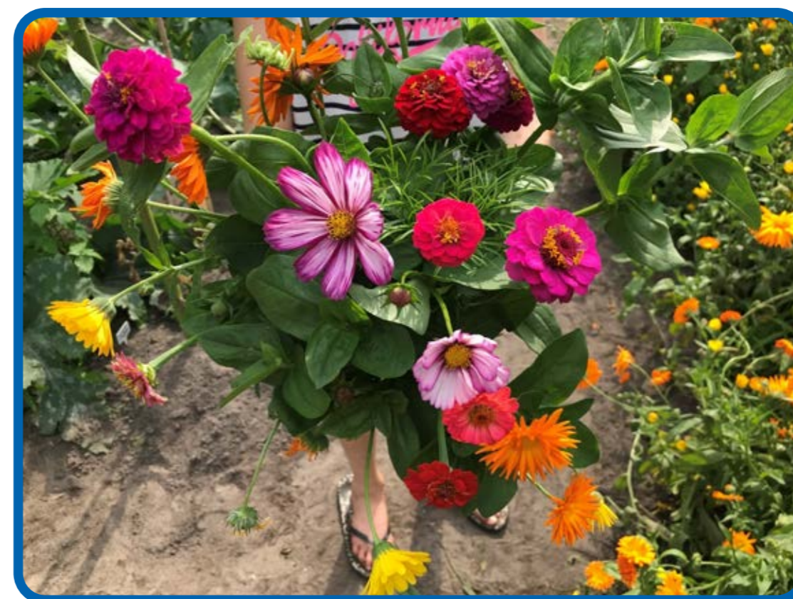
hoezo niet tevreden over de bloemenoogst????

NRC) . We krijgen ook steeds meer tropische dagen (boven dertig graden), we hadden er zo'n tien het afgelopen jaar. Ook kampen we al een aantal jaren met een extreme droogte en een neerslagtekort. Veel medewerkers hebben het afgelopen jaar dan ook regelmatig moeten sproeien.