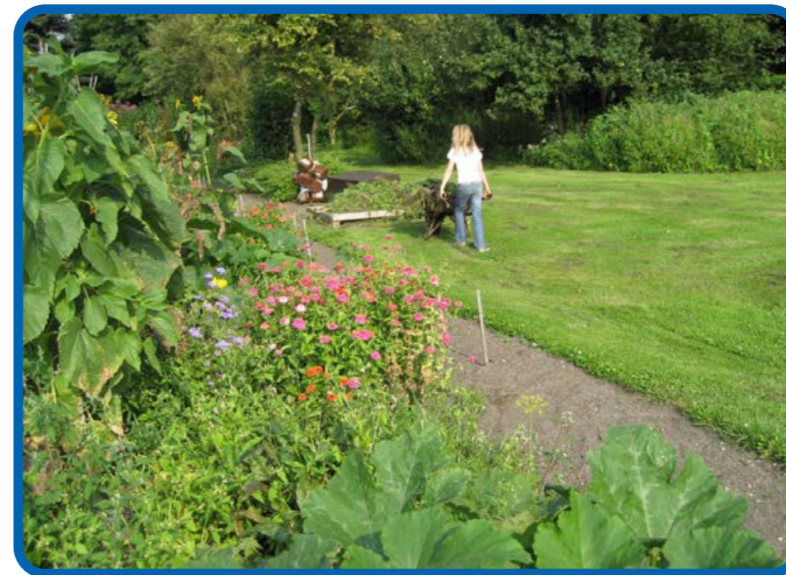
kruien naar eigen afvalhoop