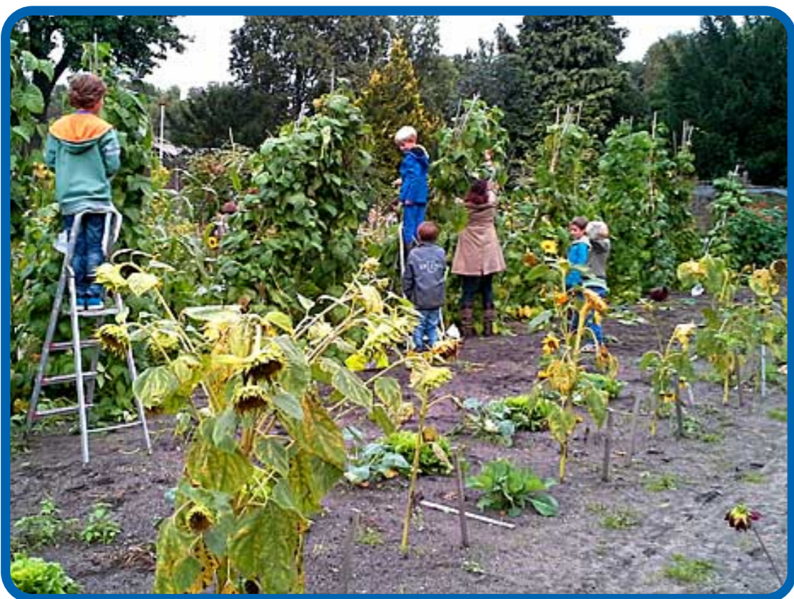
Het seizoen loopt op z'n eind. Zoeken naar de laatste bonen.

We merken ook op de tuintjes dat het klimaat verandert: een koude winter met vorst bleef uit, waardoor er in januari nog goudsbloemen op de tuintjes bloeiden. Het onkruid en de graspollen bleven leven, waardoor we het gehele seizoen last hadden van veel onkruid. Over het gehele jaar genomen was het seizoen warm en droog, met Pasen leek het al wel zomer. We krijgen steeds meer warme dagen, de laatste jaren gemiddeld 23 per jaar, dat schijnt meer dan een verdubbeling te zijn in vergelijking met honderd jaar geleden. (bron