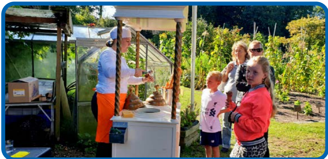
ijskar van Dolomiti