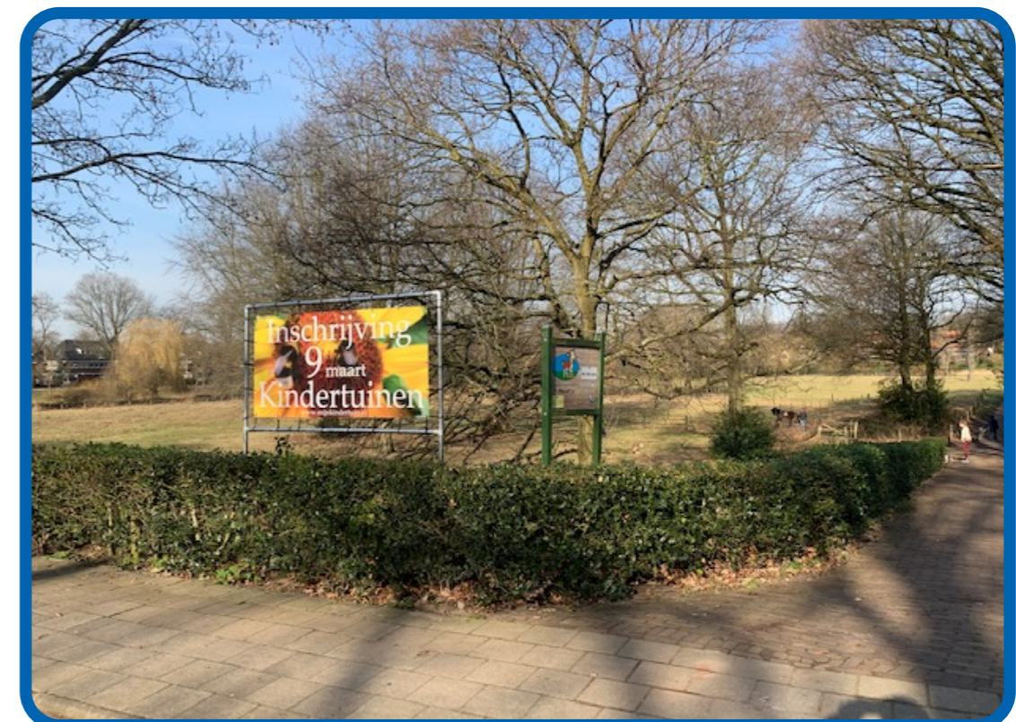
In februari verscheen een mooi bord aan de weg naar de Kindertuintjes: Inschrijving 9 maart, je kan er niet om heen.