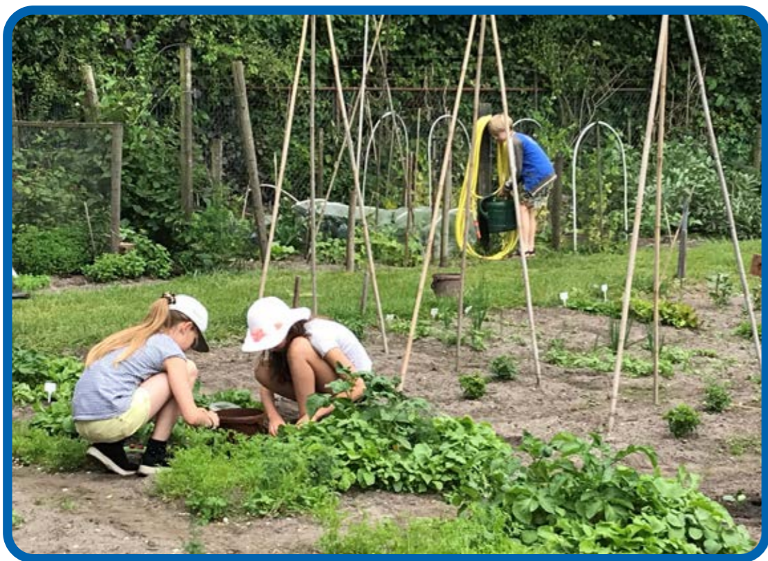
Wieden is vooral goed kijken