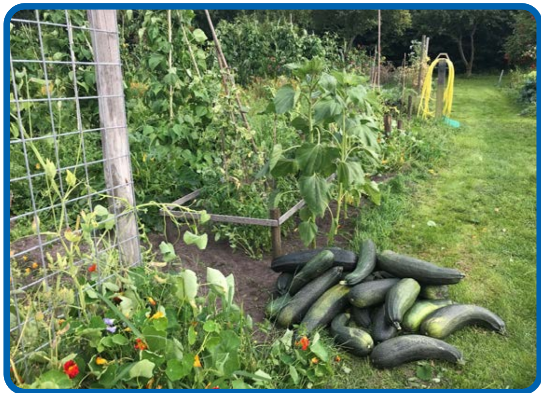
zo koop je ze niet in de supermarkt!