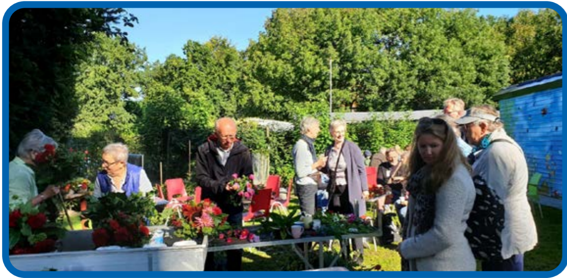
de mooiste bloemen van Bussum