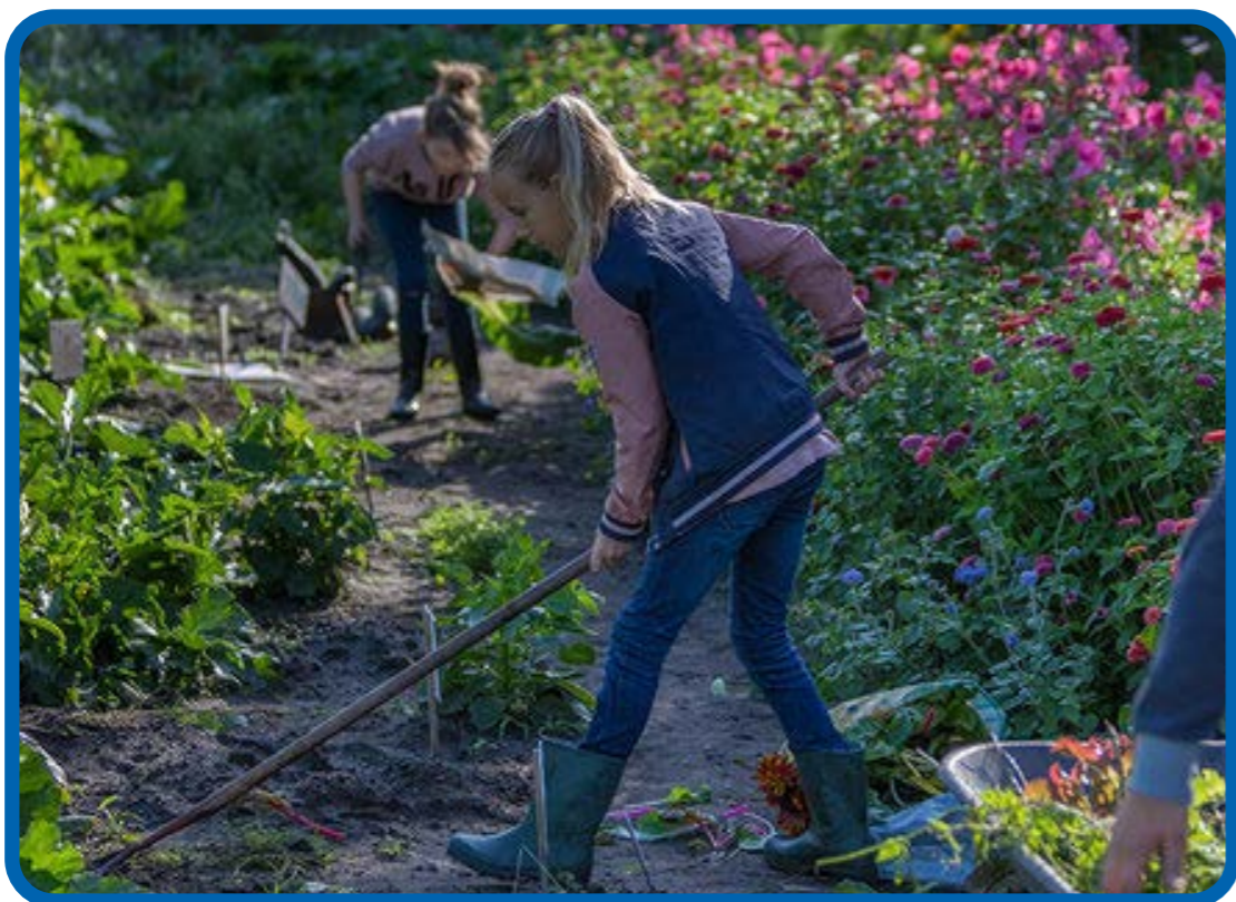
Ook nog schoppen in augustus