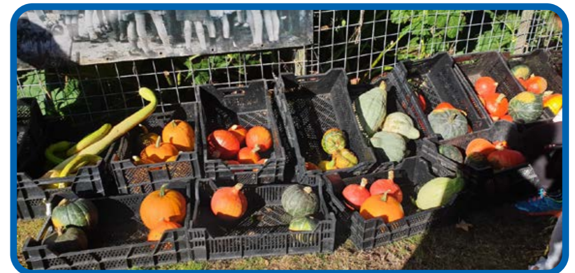
Pompoenen oranje gele en groene