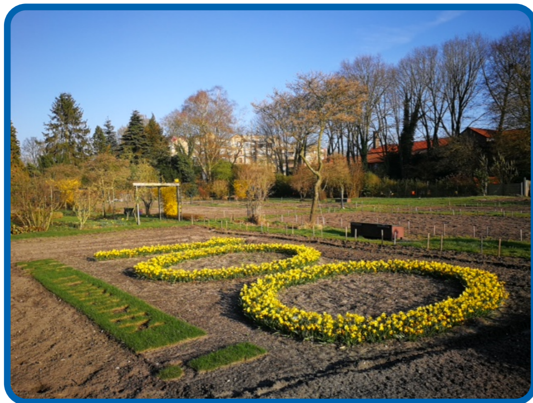
Verrassende ontvangst met krokussen bij inschrijving!