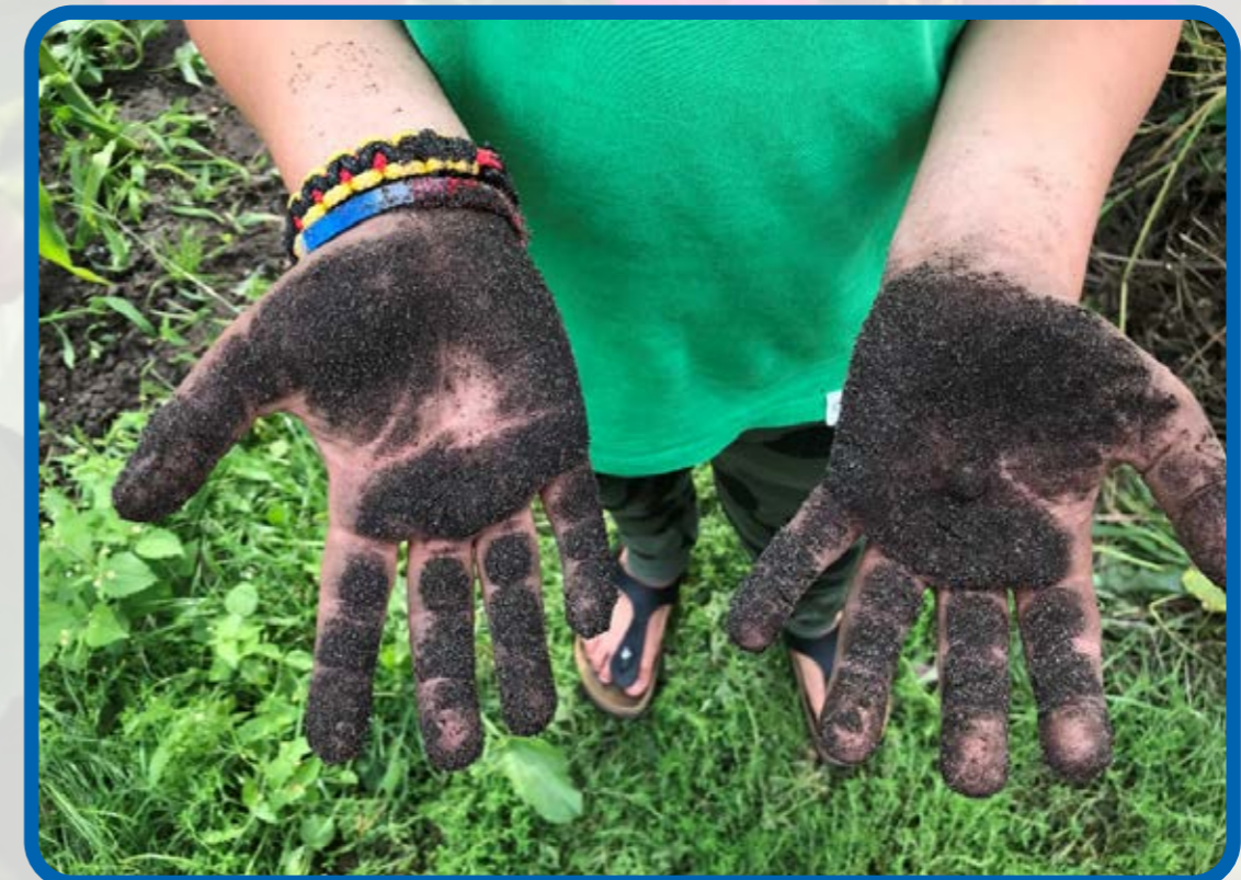
Vieze handen schoon shirt