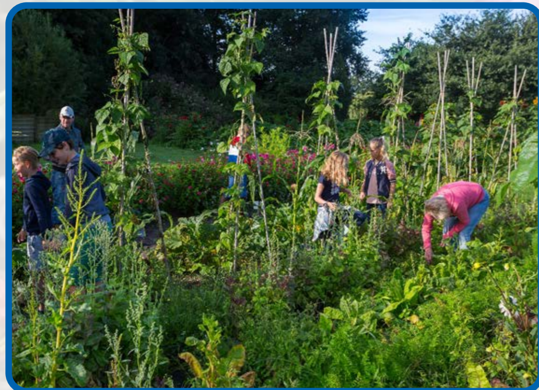
Alleen wij weten wat van wie is.