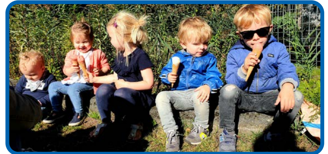
Ijsjes voor tuinierdertjes van de toekomst