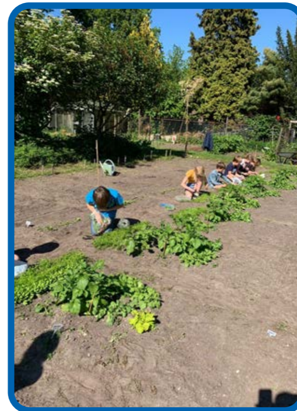
Eerste oogst altijd tuinkers en radijs