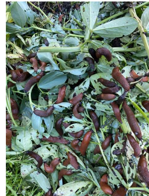
Juli 2024 slakken op de grote composthoop

Toch kunnen we spreken van een redelijk seizoen, de kinderen hebben weer tassen vol groenten en mooie bossen bloemen mee naar huis genomen.